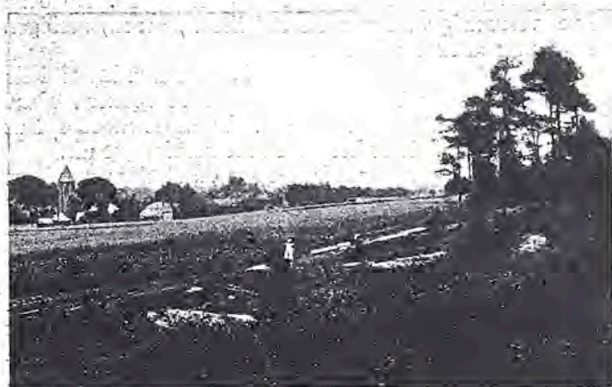
Langs de Markelose Berg.

Rechts van de hoofdweg bereikt men het Reggedal. Waar de oevers laag zijn, heeft de streek iets van ons mooi Hollands waterland, maar waar het riviertje de voet der heuvels nadert, stroomt het langs steile zandzomen, waarboven donkere mastbossen zich verheffen.