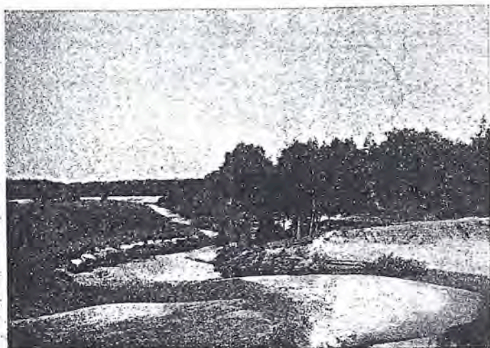
Bij de Lutte.

In een hoek van de omheinde ruimte vond men de