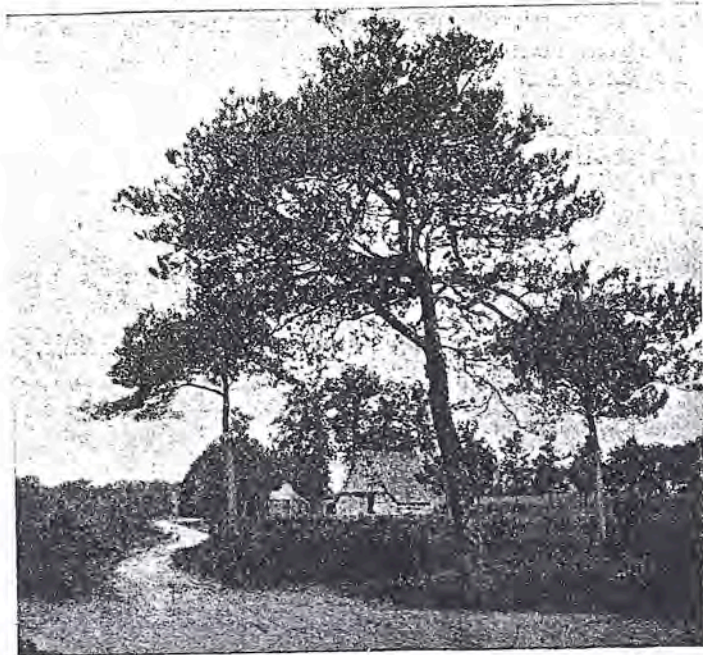
Bij de Lutte.

zware fondamente van een stenen toren, waaromheen nog enige vertrekken hebben gelegen. Uit aardewerkscherven, die hier werden opgegraven, bleek, dat het gebouw een oud Saksies kasteel is geweest.