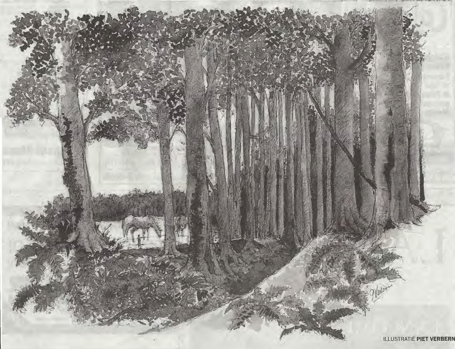
ILLUSTRATIE PIET VERBERNE

Haagbeuken hebben met gewone beuken niets van doen. Ze komen alleen in dit soort bossen voor. Door hun vorm zijn ze uitstekend geschikt voor aanplant in betrekkelijk smalle straten. Het blad is gezaagd en doet iets denken aan dat