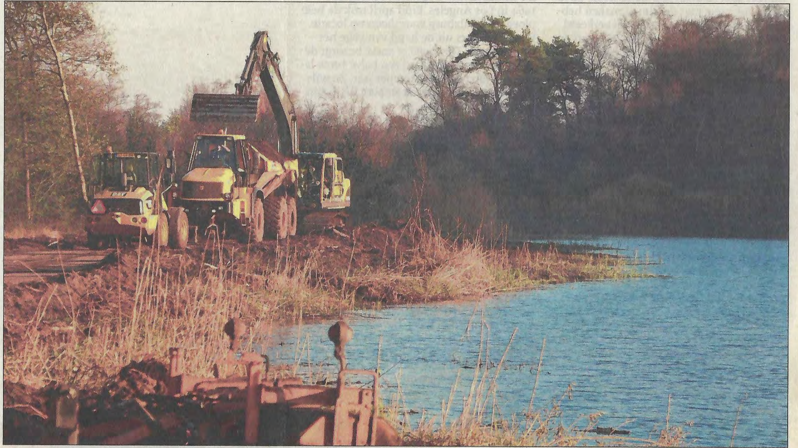
■ Een grote kraan laadt onafgebroken de enorme kiepwagens vol met zand dat afkomstig is van de hoge aarden wal die ruim 55 jaar om Het Molenven heen lag. De nieuwe oevers lopen weer net als vroeger heel geleidelijk het water in. De oorspronkelijke staat is hersteld.

Wie het schilderij dat Piet Mondriaan in 1907 van Het Molenven maakte, vergelijkt met de huidige staat, kan niet anders dan concluderen dat er sindsdien hoegenaam